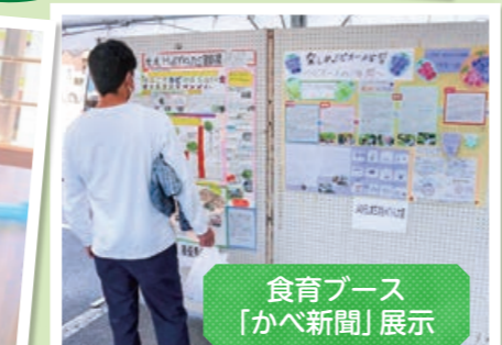
食育ブース「かべ新聞」展示