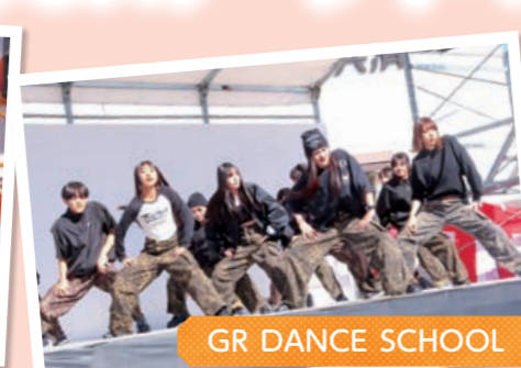
GR DANCE SCHOOL