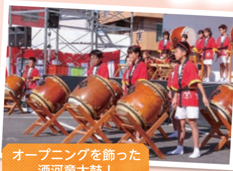
オープニングを飾った酒河童太鼓!