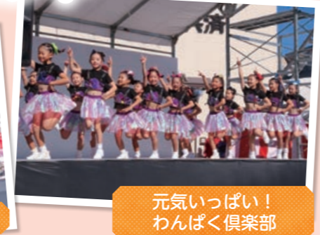
元気いっぱい! わんぱく倶楽部