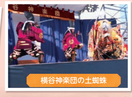
横谷神楽団の土蜘蛛