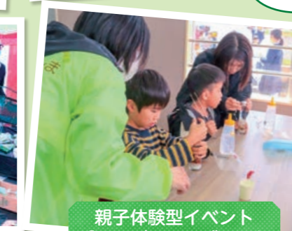
親子体験型イベント「ハーバリウムづくり」