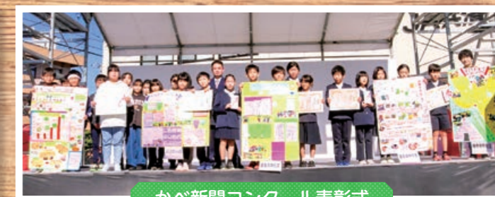
かべ新聞コンクール表彰式