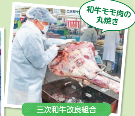
和牛モモ肉の丸焼き