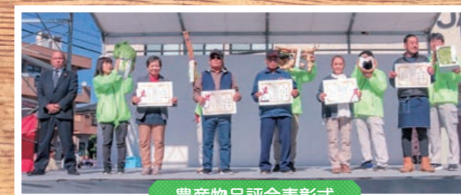
農産物品評会表彰式

11月9日、三次中央支店裏駐車場でJAひろしま三次地域ふるさと祭を開催しました。食と農をテーマに地域の農産物や加工品販売を通じて、地産地消を消費者へPRしました。ふるさと祭は、34団体の出店があり、地域の農産物や加工品の販売、JA女性部によるバザーなどの食が楽しめるブース、食農体験学習の発表の場として、「かべ新聞コンクール」「食育ブース」など、食農教育の大切さをアピールする企画もあり、来場者は生産者とのふれあいイベントでの発見を通じ、「食」と「農」について理解を深めました。特設ステージでは、酒河童太鼓の太鼓演奏を皮切りに、ダンスや神楽など、7団体による熱演に会場は熱気で包まれていました。祭りには多くの方にご来場をいただき、大いに賑わいました。